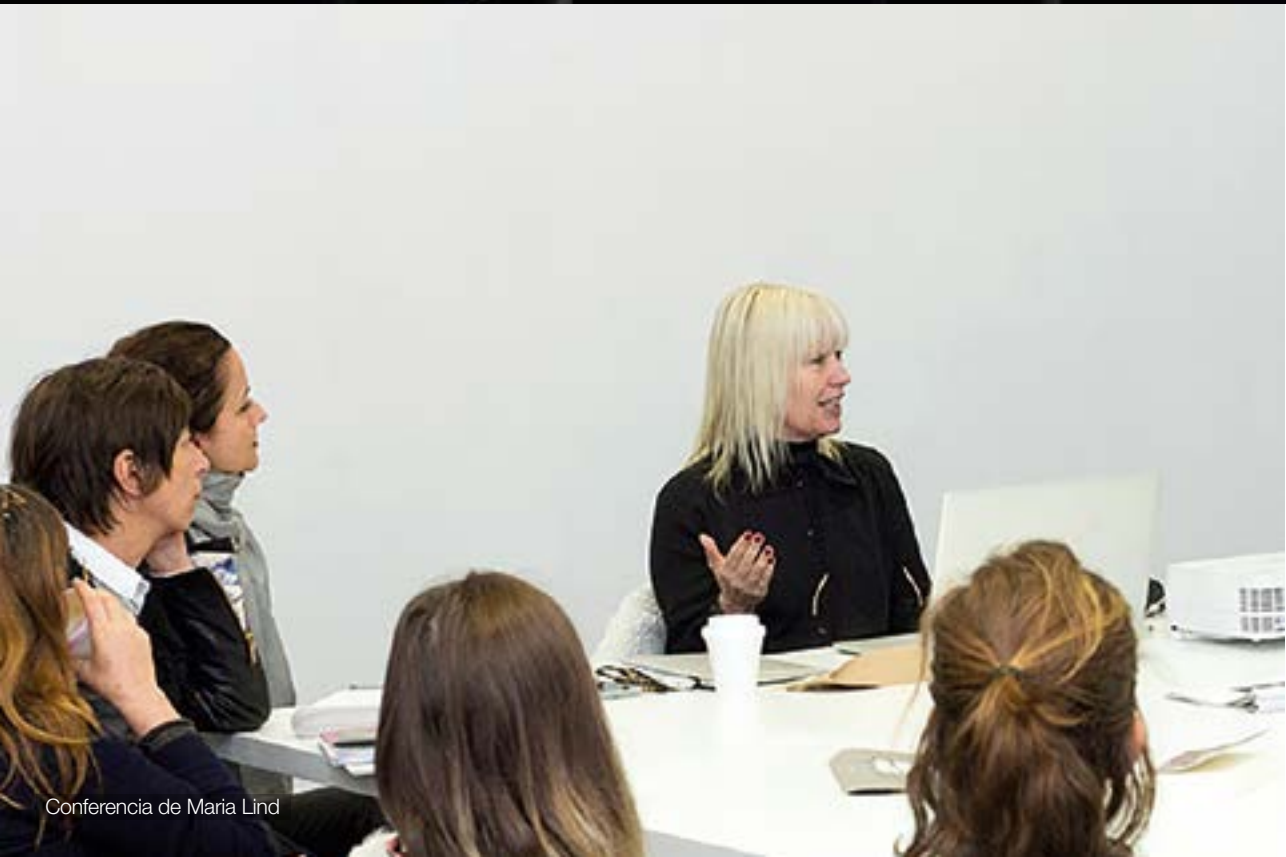
Conferencia de María Lind