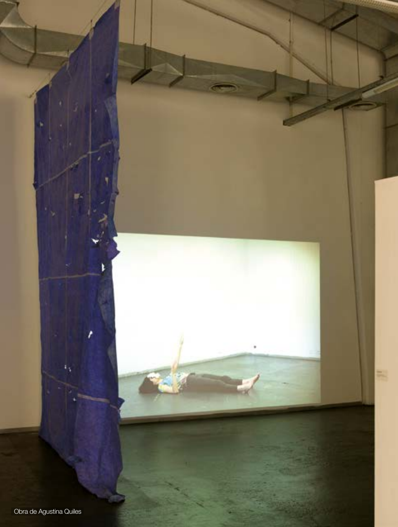
Obra de Agustina Quiles