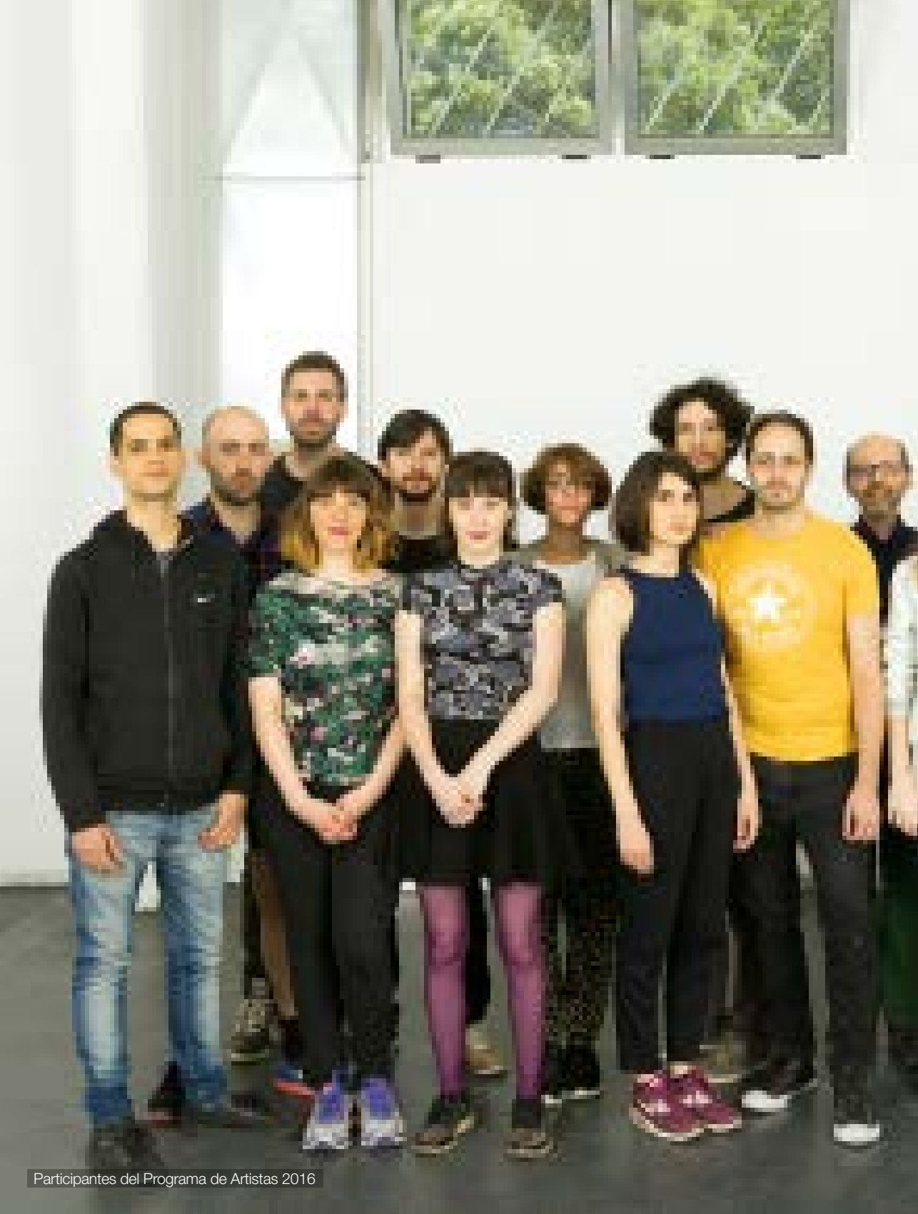
Participantes del Programa de Artistas 2016